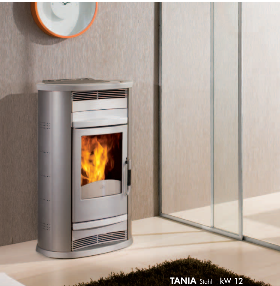
TANIA Stahl kW 12