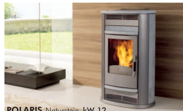
POLARIS Naturstein kW 12